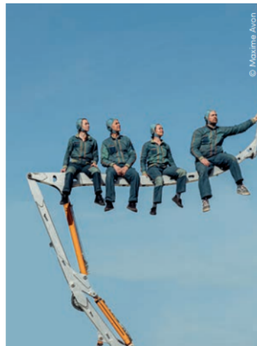
Du 12 au 14 septembre, Ramonville.