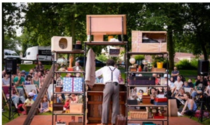
Collectif Un Cétacé