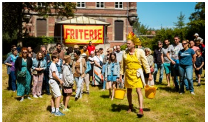
Bonjour Désordre © Kalimba