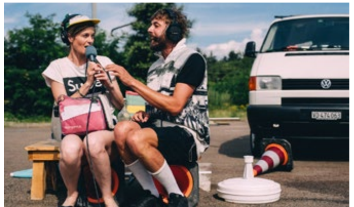
Compagnie du Rond-Point

Vous pourrez découvrir le succès de l'été 2025 de la compagnie Bonjour Désordre, le roadmovie de la compagnie du Rond-Point, les performances de danse explosives de DANS6T et .Bart, l'humour de Patrick de Valette (Les Chiche Capon) et du P'tit Cirk, les performances circassiennes de La Générale Posthume et du Club Optimiste, les univers singuliers et poétiques de Kie Faire-Ailleurs et Mathias Forge (Tuk-Tuk Production), ainsi que d'autres propositions artistiques hors du commun.