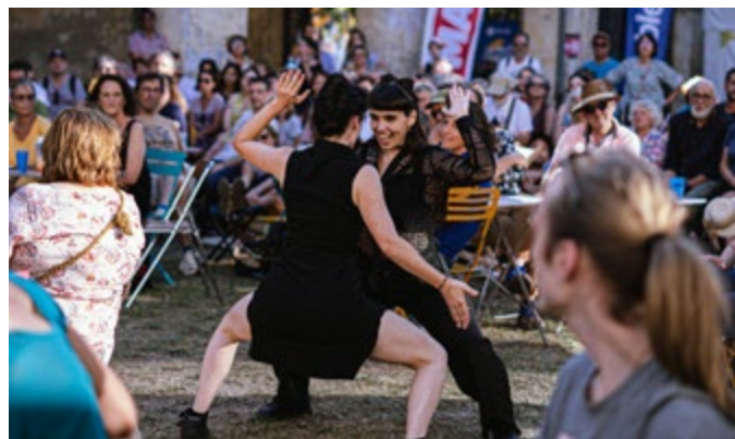
La MOÿ MOÿ

La programmation fera également la part belle aux artistes catalan-es grâce à trois compagnies invitées en partenariat avec l'Institut catalan Ramon Llull (Arrangement provisoire - Jordi Galí, Cia Nacho Flores et Cris Clown).