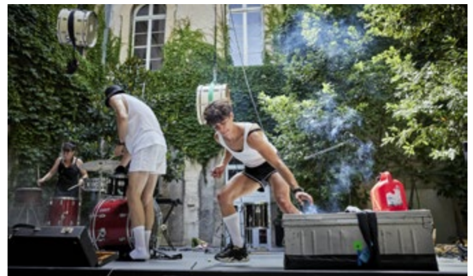
Club optimiste